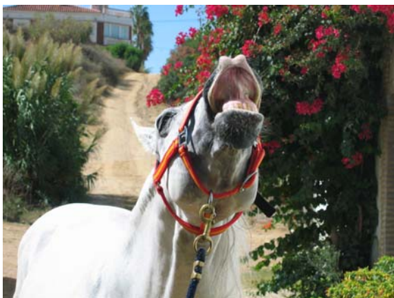
Pferde kennen keinen Unterschied

... Erspüren des eigenen Körpers und seiner Bewegungsfähigkeit